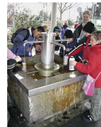
Sauerbrunnen im Frühjahr 2006