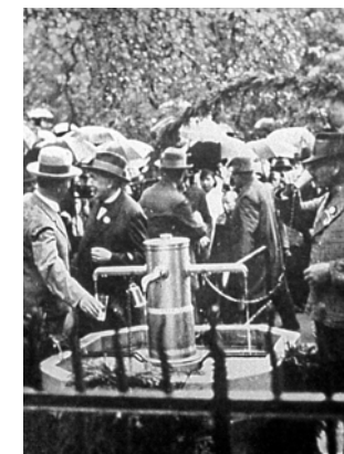
Einweihung des Sauerbrunnens 19. Juli 1931

Der nächste bekannte Vulkanschlot von hier ist nur 7,5 Kilometer entfernt (Burrenschlot). Mehrere Schlotte liegen 12 Kilometer entfernt bei Aichelberg. Einen weiteren Hinweis auf diesen tertiären Vulkanherd gibt die Mineralquelle in Gingen. Sie wurde in 154 Meter Tiefe erbohrt und hat eine Temperatur von 21 Grad Celsius, ist also um 5 bis 8 Grad wärmer, als eigentlich zu erwarten war.