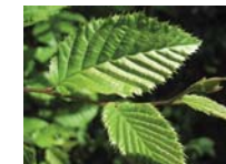
Blatt der Weißbuche