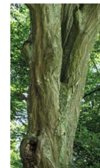
Stamm einer Weißbuche

Die Bezeichnung Buchrain macht folgende Geschichte wahrscheinlich: Am Südrand der Gemarkung Eislingen gab es ein Gewinn mit Äckern, zwischen denen Weißbuchenhecken wuchsen. Als die Nutzung aufhörte, breiteten sich die Weißbuchen zum Wald aus. Auch heute wachsen im Buchrainwald (neben Eichen und Rotbuchen) noch auffallend viele Weißbuchen. Es ist die Baumart mit den seilartig gedrehten Stämmen.